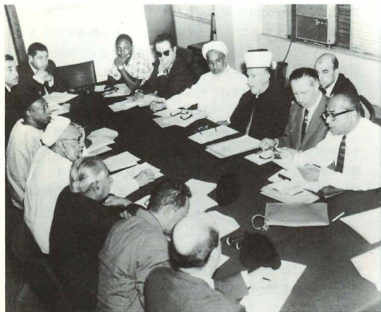
世界イスラム協議会執行理事会

庭野平和賞はまた、善意と理解の掛け橋を作り、真の世 界平和の基盤を強化することにも貢献しています。