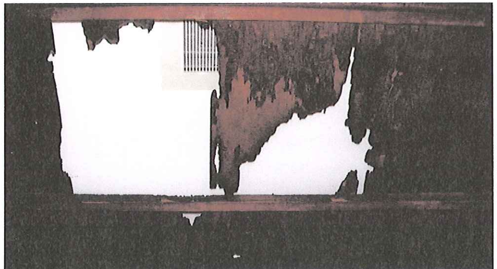
(右) アメリカの焼夷弾が つুক্তた作品 「天井の穴」