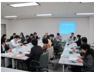
関係者会議(2011年10月13日)