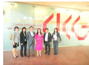
日本からの参加者