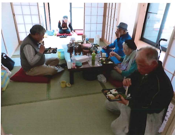
仮設集会所へのお弁当配食サービスと見守り支援