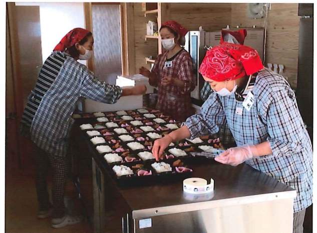
ワタママたちによるお弁当づくり