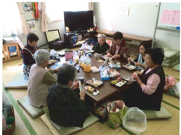
仮設住宅集会所でのお弁当食事会