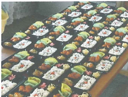
お弁当作りに 励む ワタママさん