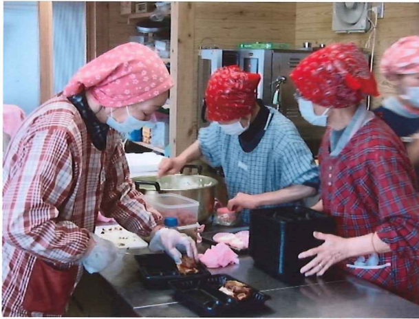
お弁当づくりに励むワタママたちの