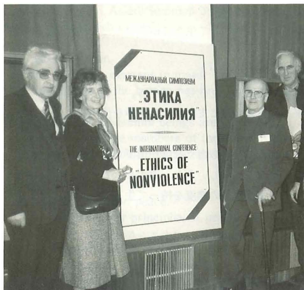
1989年、「非暴力の倫理」に関する国際セミナー期間中にソ連科学学会・倫理学部の指導者と共に（於：ソ連・モスクワ）

bacteriological and chemical weapons, are easily predictable.