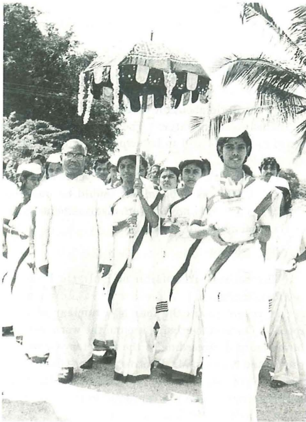
1980年から1986年まで、M.アラム博士は、南インドのマズーライ市近郊にあるガンディーグラム農村大学副総長を務めた。M.アラム博士は、シャーンティ・セーナの概念を作業モデルへ発展させる助力をし、これは、世界的に非暴力を建設するための行動方法として広く認められている。写真は、シャーンティ・セーナのメンバーがアラム博士を伝統的なブルナ・クンバムで称えているところ。

国連は数々の地域の紛争解決において活躍しています。国連平和維持軍は平和維持においてきわめて重要な役割を果たしてきました。1988年には平和維持活動に対しノーベル平和賞が授与されています。