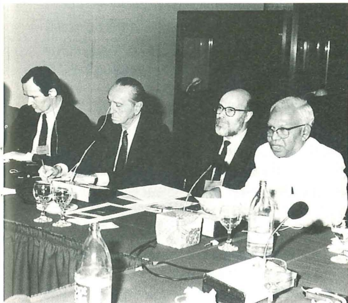
スペインのバルセロナで開かれた「平和の文化に対する宗教の貢献についてのユネスコ専門家会議」の送別講演会で演説するM.アラム博士。バルセロナ・ユネスコ・センター所長、フェリックス・マルティ氏とユネスコ人権と平和部長、サイモン氏。(1993. 4)

1982年、第2回国連軍縮総会が開催されました。WCRPの初代事務総長であるホームー・A・ジャック博士は、国連における核軍縮運動推進に活躍しました。庭