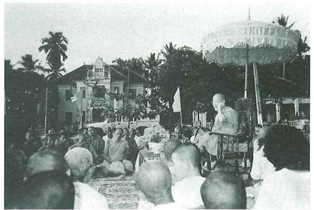
野外で僧侶たちに説法しているゴースナダ師 Maha Ghosananda preaches to priests out of doors.

よって、当財団では、「宗教的精神に基づいて、宗教協力を促進し、宗教協力を通じて世界平和の推進に顕著な功績を挙げた人（または団体）」を表彰し、これを励ますことによって、その業績が世の人々を啓発し、宗教の相互理解と協力の輪を広げて、将来世界平和の実現に献身する多くの人々が輩出することを念願として、庭野平和賞を設定致しました。第1回受賞者はヘルダー・P・カマラ大司教、第2回はホーマー・A・ジャック博士、第3回は趙樸初師、第4回はフィリップ・A・ポッター博士、第5回は世界イスラム協議会、第6回は山田恵諦天台座主、第7回はノーマン・カズンズ博士、第8