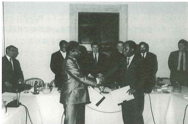
モザンビーク紛争の和平調印

The year 2000 is a date full of significance for the Christian world, and prompts Christians to look with greater faith and greater hope to the future. There is, however, a need for all people, Christians and non-Christians, religious persons and those who are uncommitted, to look with greater faith and greater hope to the future of the world and of humanity after such a dramatic and violent century. The moratorium on the death penalty is a step in this direction: suspending executions throughout the world and taking a deeper look at this problem would constitute a sign of innovation that would influence positively the spiritual and social development of the whole world.