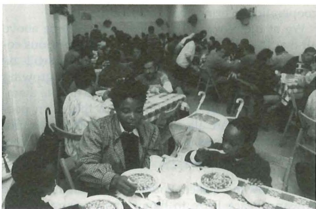
聖エジディオ共同体のスープ・キッチン

毎年5月、贈呈式を行い、正賞として賞状、副賞として賞金2,000万円及び顕彰メダルが贈られます。また引き続き受賞者による記念講演が行われます。