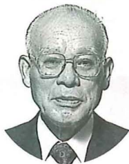
庭野平和財団 理事長