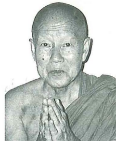
From Ven. Samdech Preah Maha Ghosananda, Founder of the Dhammayietra Center for Peace and Nonviolence of Cambodia (Recipient of the Fifteenth Niwano Peace Prize)

The Dhammayietra Center is focusing on bringing peace to Cambodia, Asia, and the world. The suffering of Cambodia has been deep. From this suffering comes Great Compassion.