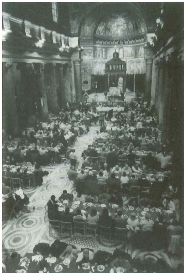
クリスマス昼食会

2000年という年は、キリスト教徒に対してもっと信頼と希望を持って未来を見つめるようにと促す、キリスト教世界にとっては極めて大きな意味を持つ年であります。しかし、このように劇的で暴力に満ちていた一世紀の後に、世界と人類の未来をもっと信頼と希望を持って見つめることは、キリスト教徒であってもなくても、宗教を信じていてもいなくても、全ての人に必要なことです。死刑執行を停止は、その意味での一歩となるものです。世界中で死刑の執行を停止し、この問題についての思索を深めることは、世界のすべての国々の精神的、社会的発展にとって好ましい影響をもたらすかもしれない新しい試みの一つとなるでしょう。