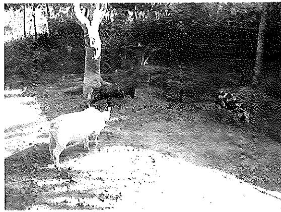
豚を購入した受益者、多くは牛、豚、ヤギを購入した