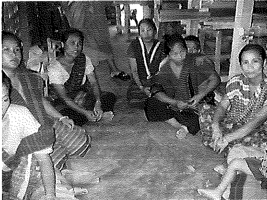
織物センターの女性たち