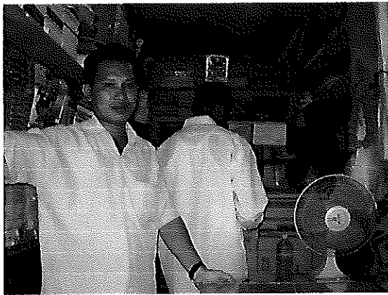
小規模商業活動 コピー屋さんを始めた受益者