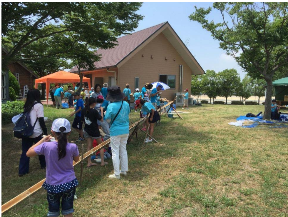
プログラム開催中にモニタリングのため訪問 8月4日東はりまゆるわくキャンプ