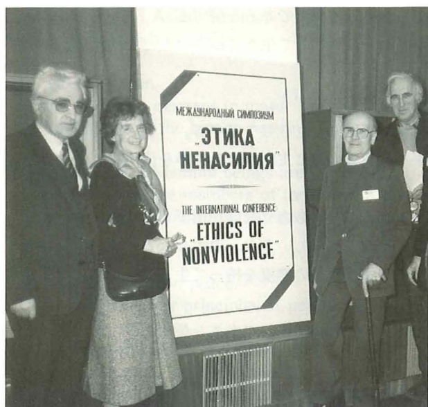
1989年、「非暴力の倫理」に関する国際セミナー期間中にソ連科学学会・倫理学部の指導者と共に（於：ソ連・モスクワ）

bacteriological and chemical weapons, are easily predictable.