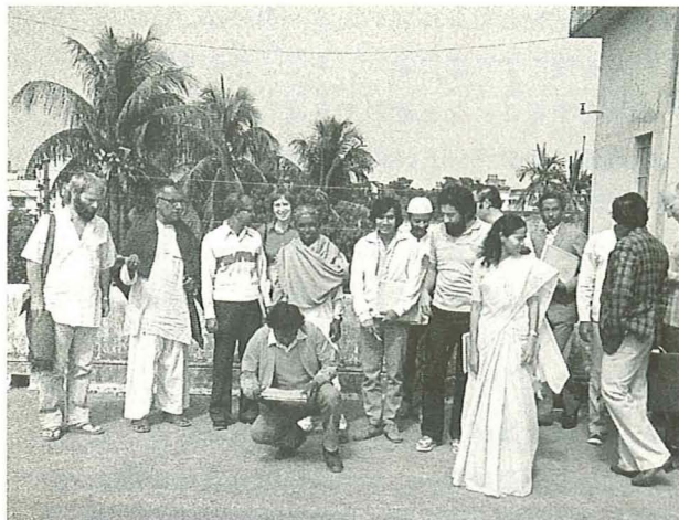
1985年、非暴力に関するセミナーの参加者と共に(於：バングラデシュ・ダッカ)

1961年、私達は、ユーゴスラビアにおけるカトリックと東方正教会の緊張関係の問題にかかわって欲しいと頼まれました。この問題は、古くからのクロアチア人とセルビア人の間の対立に深く結びついていたのです。ザグレブでカトリックのクロアチア人に会った時、彼ら