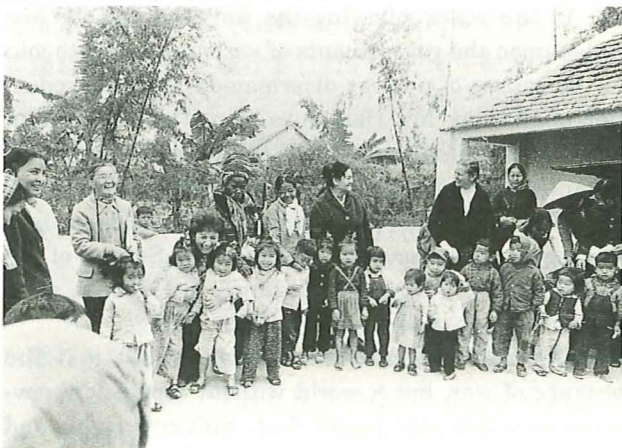
1973年、ベトナムのデイケアセンターにて

civil liberties; an economic system which is not exploitative; housing and education of the kind each person wants; consumerism under control; the environment being helped to recover; universal health care.”