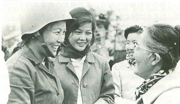
1973年、ベトナムにて女性海兵隊員と

Some countries, led by the United States, are call-