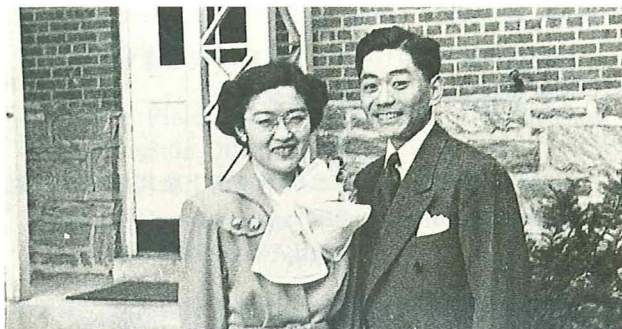
1946年、イチローとマリイ結婚当時