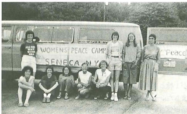
1983年、セネカでの平和キャンプ

Life for the immigrant Japanese was not easy. They were the victims of a great deal of racial prejudice. They could not become naturalized citizens of