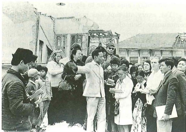
1973年、米軍による爆撃を受けたイチヤム・トルイン通り（ベトナム）