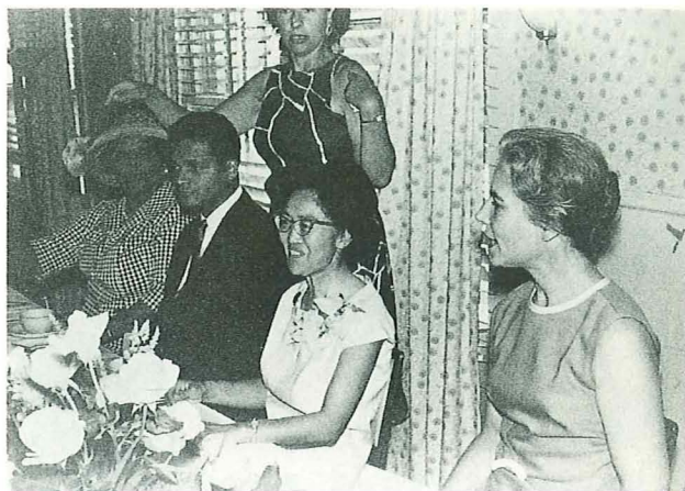
1965年、WILPFのパーティにて

士、第8回はヒルデガルド・ゴス・メイヤー女史、第9回は A.T. アリヤラトネ博士、第10回はネーブ・シャローム／ワハット・アル・サラーム、第11回はパウロ・エヴァリスト・アルンス枢機卿、第12回はM. アラム博士でありました。