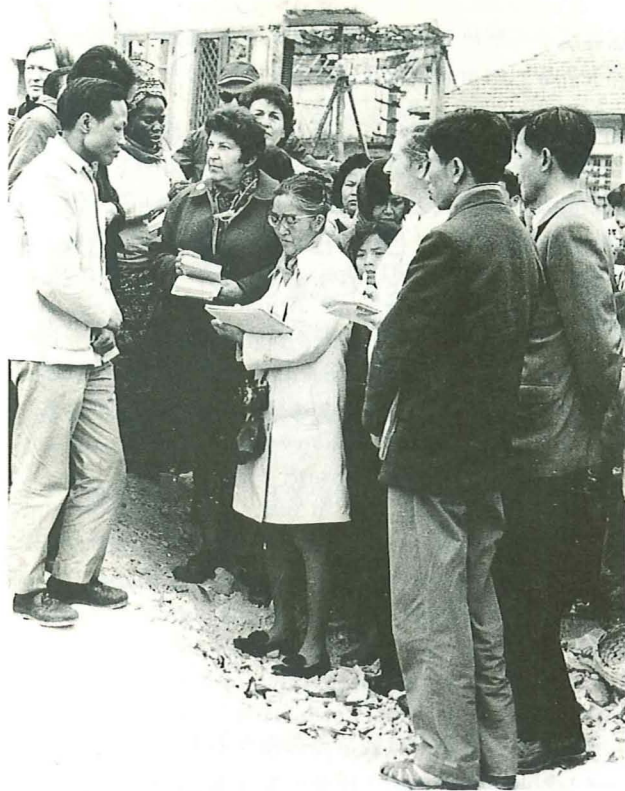
1973年、米軍による砲撃後のベトナムを訪れて

mountainous area and on an old lake bed in California, one in Utah, one in Colorado, one in Wyoming, two in Arizona, one in Idaho and two in Arkansas. Each camp consisted of tarpaper-covered barracks divided into blocks of two sections with 12 barracks for residential use. Each group of residential barracks had one barracks used for a communal wash-room, latrine and bath and another that was the communal kitchen and dining room. Each family was assigned one room. The size of the room depended on the number in the family. Each barracks had six rooms. Very large families got two rooms. Each room had a small stove which used coal for heating.