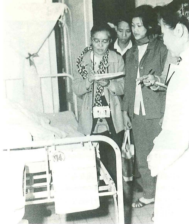
1973年、ベトナムの病院にて

1941年、日本軍による真珠湾攻撃が起こります。アメリカ政府は、その報復として、アメリカ西海岸の日系人12万人を砂漠地帯の「強制収容所」に隔離しました。鉄